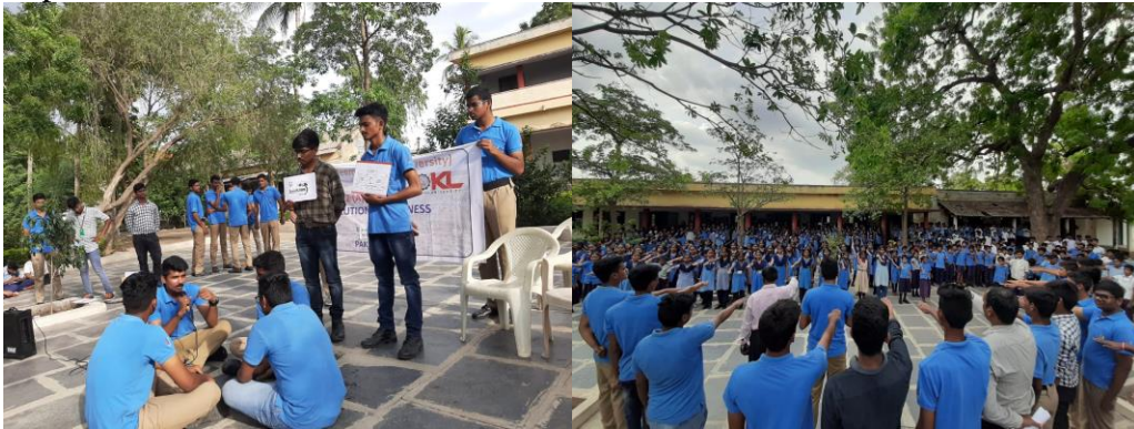
Picture: Pollution Awareness Program by EEE NCC group at Nuthakki ZPHSchool

KLEF , EEE department has conducted DST sponsored INSPIRE CAMP 2019 from 29th July to 02 August, "Innovation in Science Pursuit for Inspired Research" (INSPIRE) is an innovative programme initiated by the Department of Science and Technology (DST), Govt. of India, to attract talents to the excitement and study of science at an early age. The Science Camps will be addressed by top scientists of India including Bhatnagar Awardees and global icons of Science including Nobel laureates. The students will also be exposed to hands-on experience in advanced laboratories For attending INSPIRE Science Camp, student need not pay any amount either to the school or to the organizer K L E F (Deemed to be University). The camp is totally free of cost for the student. As the host Institute, we shall take all care of the students including travel, accommodation, fooding, security, miscellaneous expenses, etc.